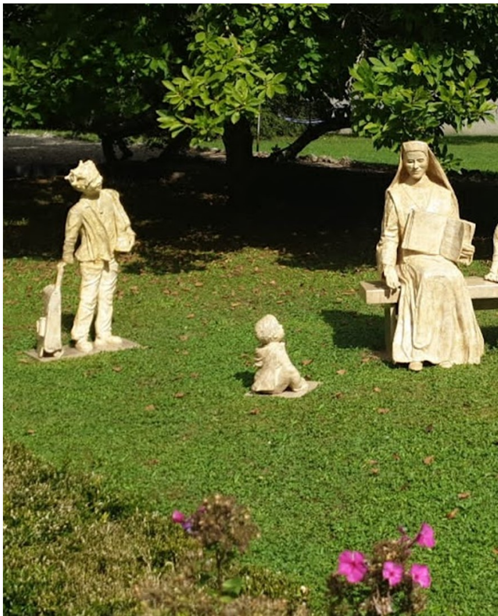
Statues de sainte Léonie entourée des enfants :