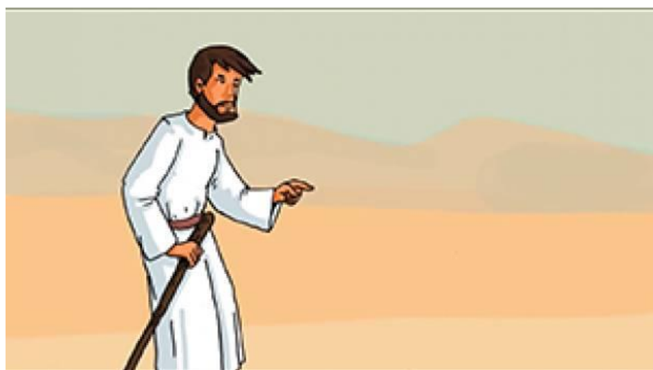
Jésus au désert