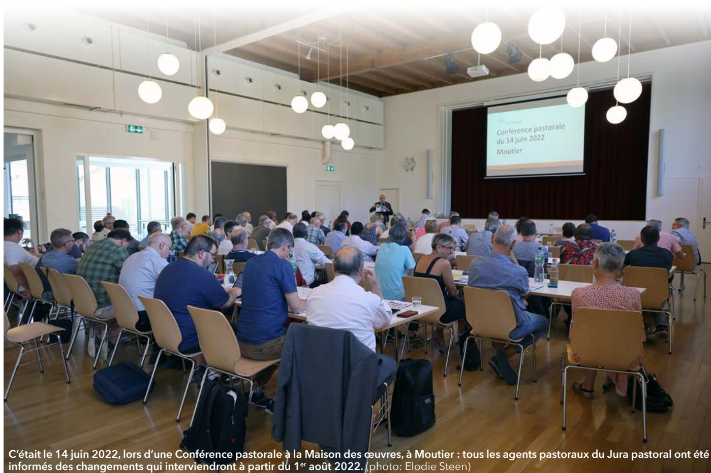
C'était le 14 juin 2022, lors d'une Conférence pastorale à la Maison des œuvres, à Moutier : tous les agents pastoraux du Jura pastoral ont été informés des changements qui interviendront à partir du 1 er août 2022.