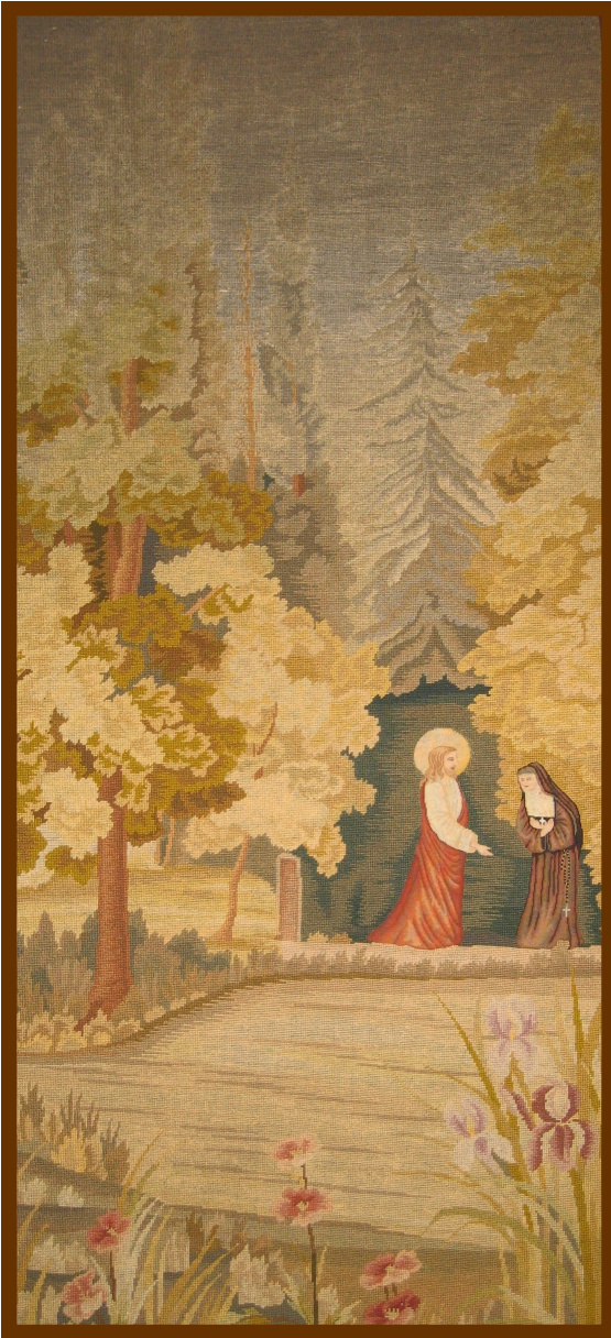
Gobelin se trouvant au Musée de la Mère Chappuis