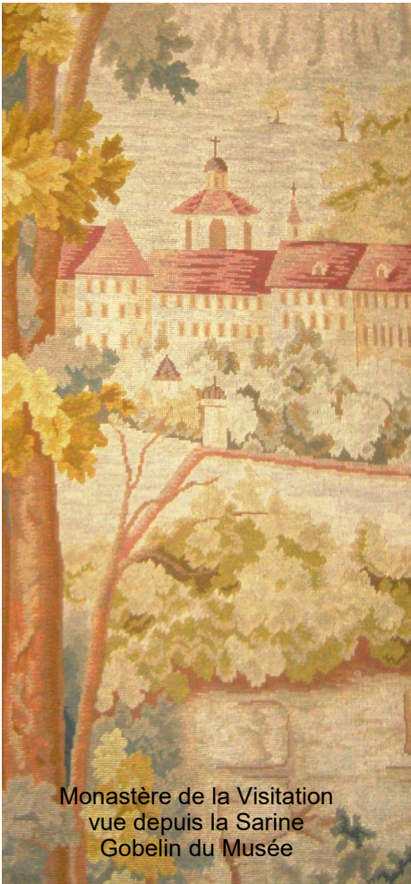
Monastère de la Visitation vue depuis la Sarine Gobelin du Musée