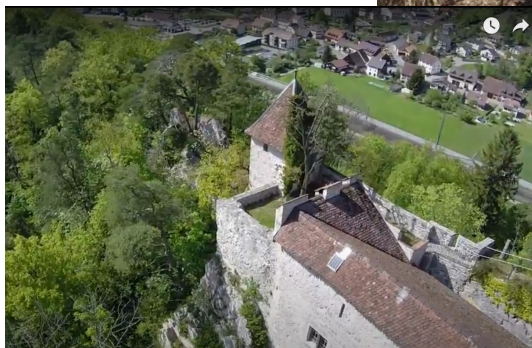
Château de Soyhières