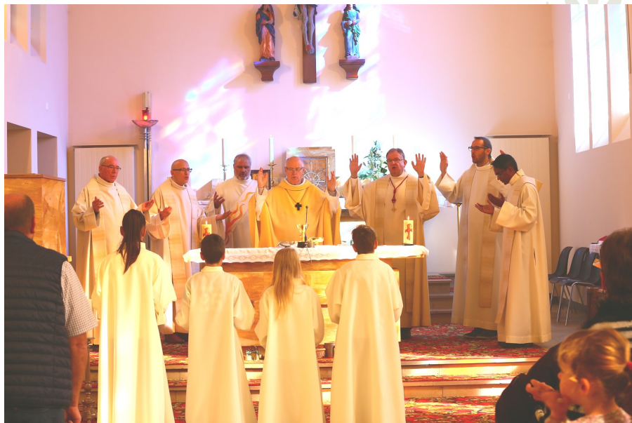
Après l'Eucharistie, procession et prière à la crypte