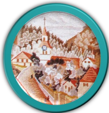
Vue de Soyhières Détail d'une tapisserie du Musée de la famille Chappuis

Oyez la bonn' Nouvell', habitants de céans Retour dans nos villag'es, exilés du vieux temps Oyez la bonn' Nouvell', et soyons accueillants Leurs racines au villag'e repouss'ront au prin- temps !