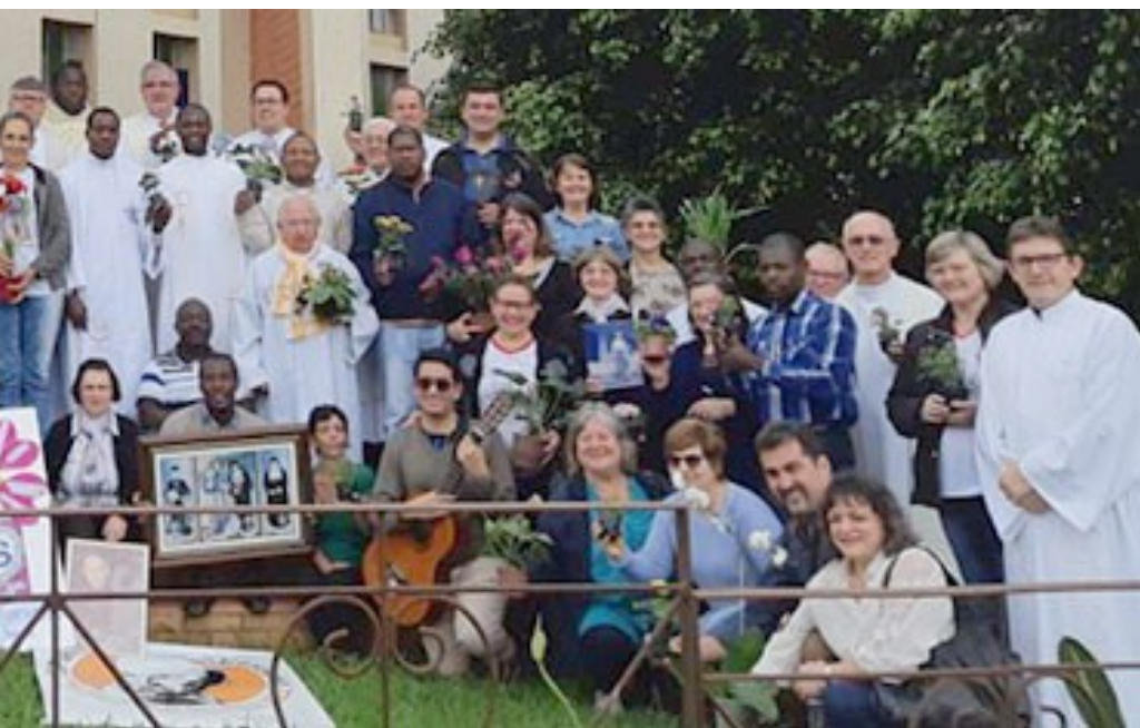
Groupe salésien du Brésil, pour fêter l'anniversaire de la Bonne Mère