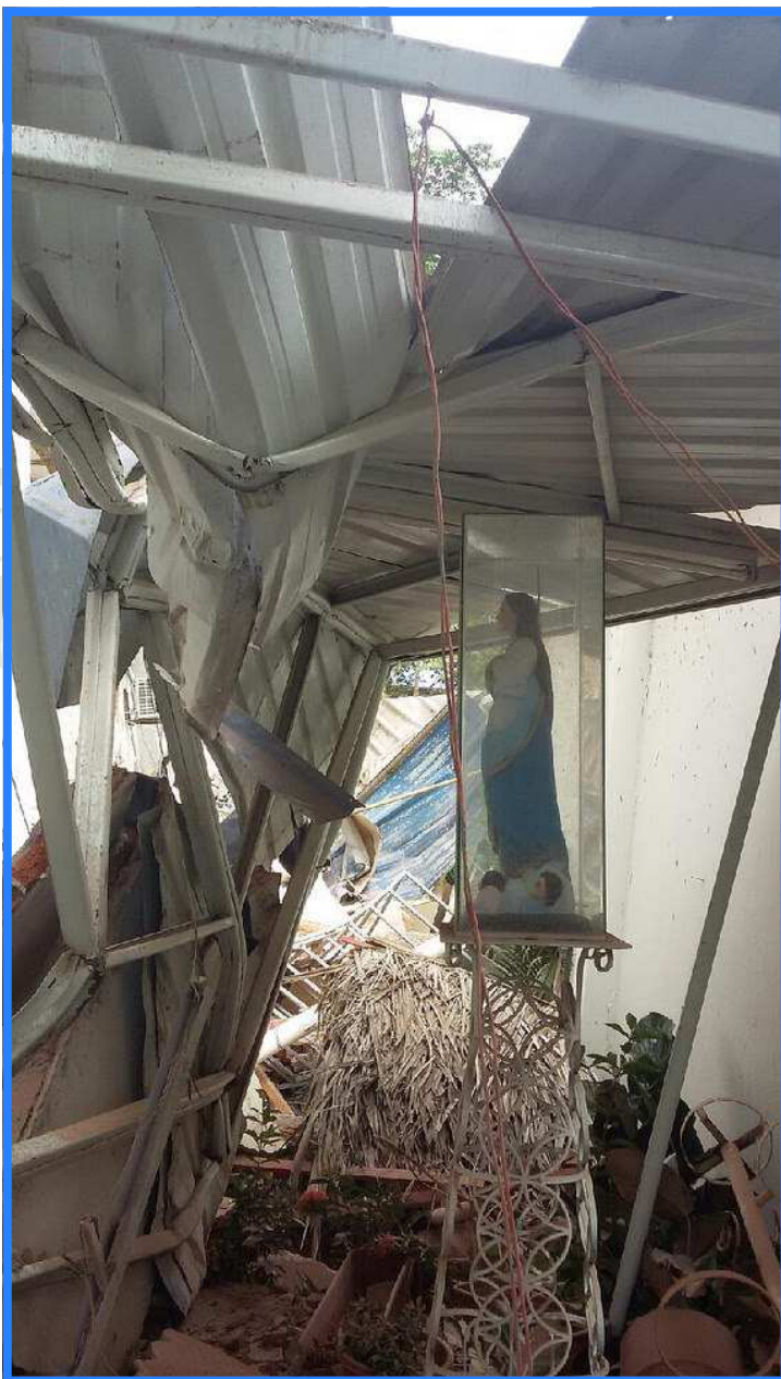
Statue de Notre-Dame de Lumière restée intacte au milieu des décombres