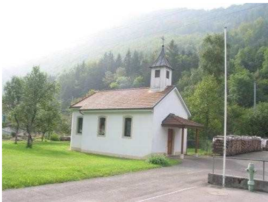
Chapelle St-Joseph située au centre du hameau des Riedes,